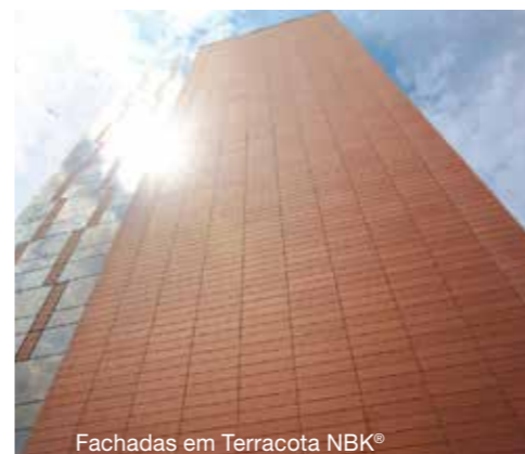
Fachadas em Terracota NBK®