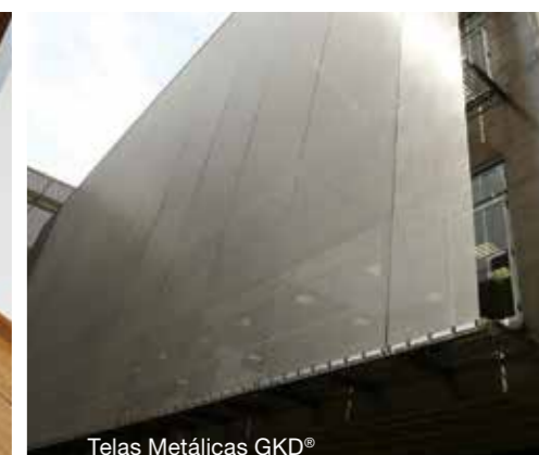
Telas Metálicas GKD®

A Hunter Douglas atende aos mais exigentes requisitos em Arquitetura e Design de Interiores, com soluções e produtos inovadores.