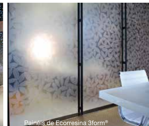
Painéis de Ecorresina 3form®