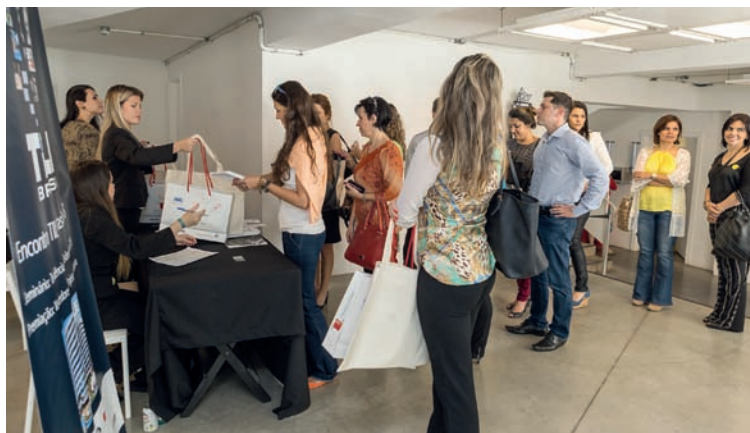
Evento realizado no MIS em 6 de novembro 2014