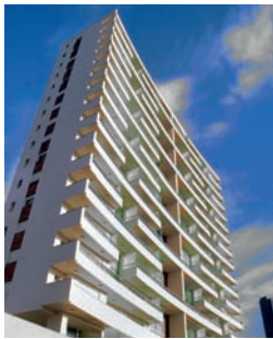
Torres e Bello 3º lugar na Categoria Fachadas com o Tutto Residenziale