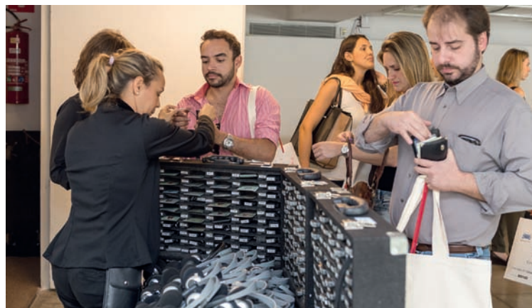
Equipamentos para tradução simultânea