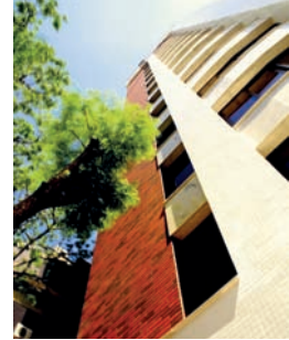
Haas & Jesus 2º lugar na Categoria Fachadas com o Vale du Loire