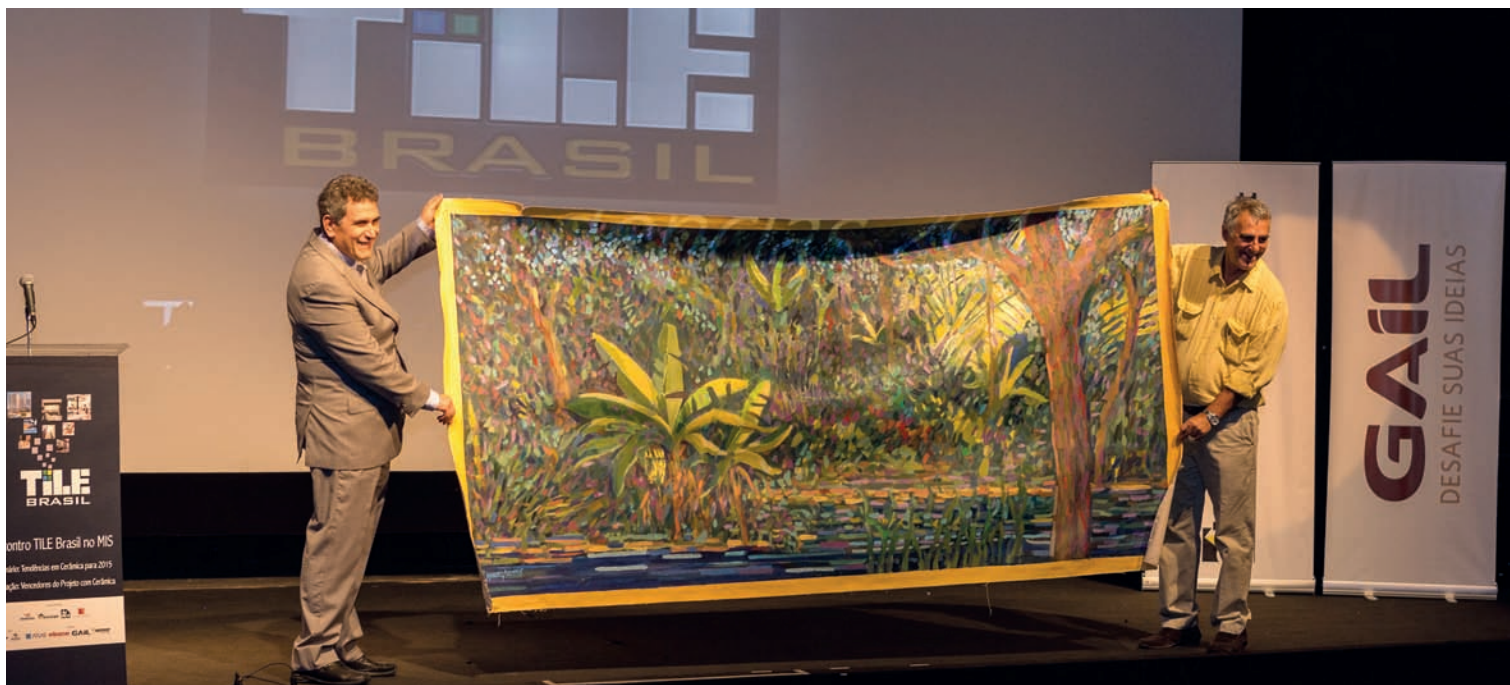
A pintura 'Salve Selva' do artista plástico Manoel Britto é um exemplo de obra de arte a ser reproduzida em cerâmica

A exemplo de Portinari e Rivera, artistas plásticos podem ter suas obras reproduzidas e até desenvolvidas em mosaicos cerâmicos. Com a evolução da impressão digital em cerâmica, esta é uma fronteira já superada para projetos ousados