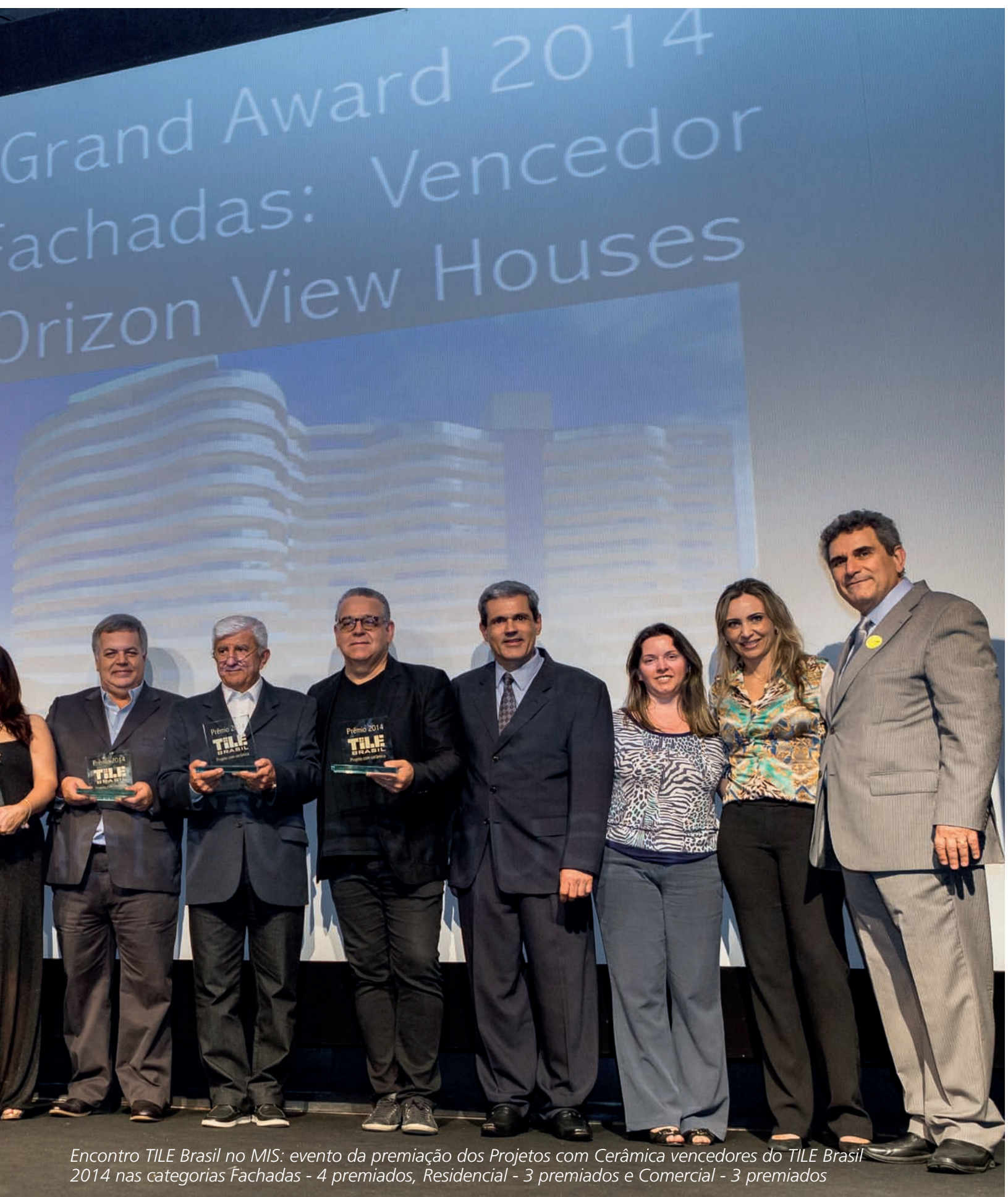
Encontro TILE Brasil no MIS: evento da premiação dos Projetos com Cerâmica vencedores do TILE Brasil 2014 nas categorias Fachadas - 4 premiados, Residencial - 3 premiados e Comercial - 3 premiados