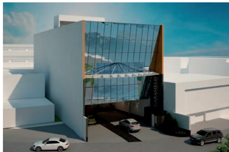
VIDROS DE CONTROLE SOLAR E A INCLINAÇÃO DA FACHADA COLABORAM COM O CONFORTO AMBIENTAL

O ângulo de inclinação da fachada em 11 graus ajuda a reduzir a incidência dos raios de sol sobre o pano de vidro. Ela será totalmente fechada com vidros de controle solar autolimpantes, que repelem a formação de gotículas de água. Todos os quadros de vidro serão fixos e os ambientes internos climatizados. A dez metros de altura do térreo, uma marquise com estrutura metálica e cabos tensionados, em forma de segmento circular, com 15 metros de raio, torna-se elemento arquitetônico de destaque e também colabora com o sombreamento da face de vidro do primeiro pavimento.