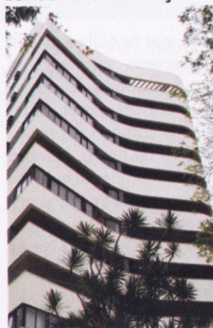
Edifício Portal da Graça

“ Quando a economia é estável, há uma movimentação maior de toda a cadeia produtiva ”