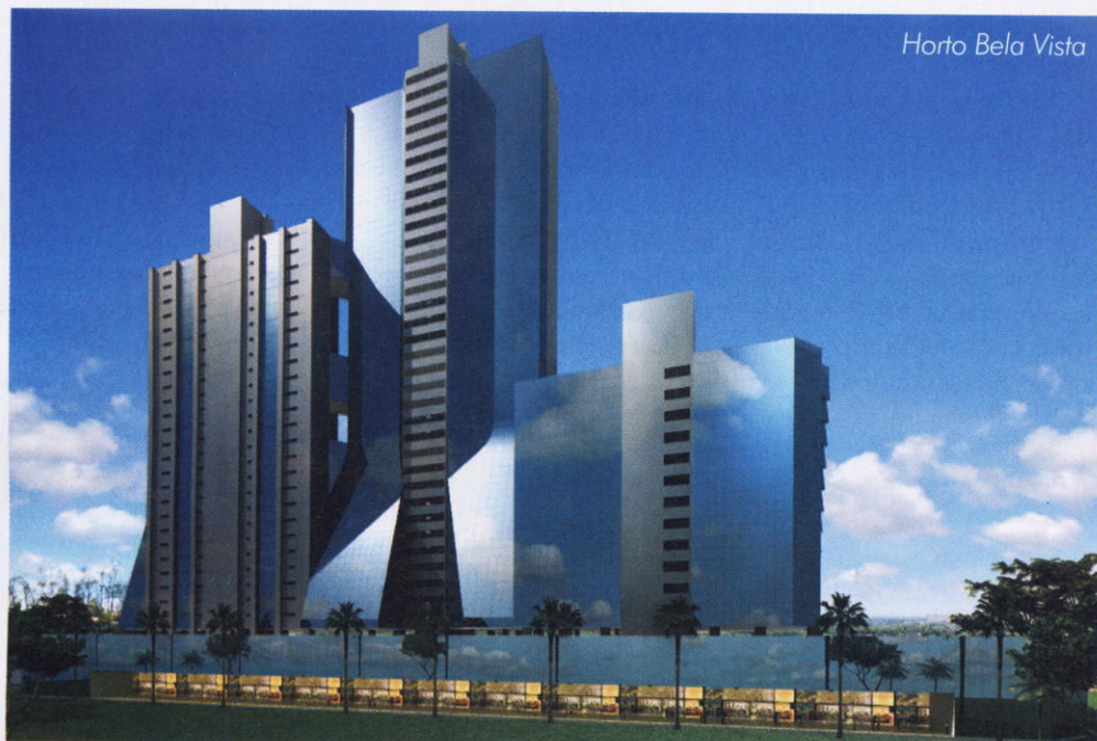
Horto Bela Vista