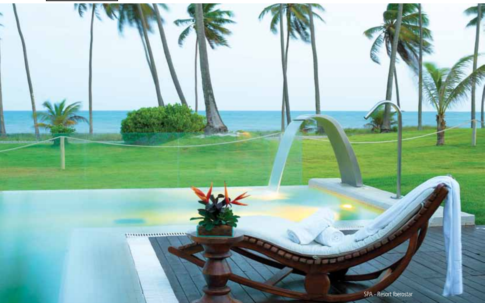
SPA - Resort Iberostar