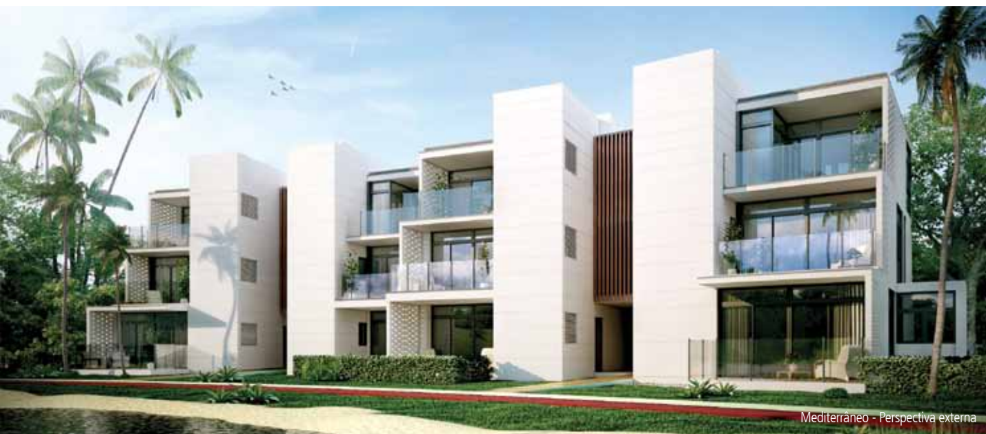
Mediterrâneo - Perspectiva externa