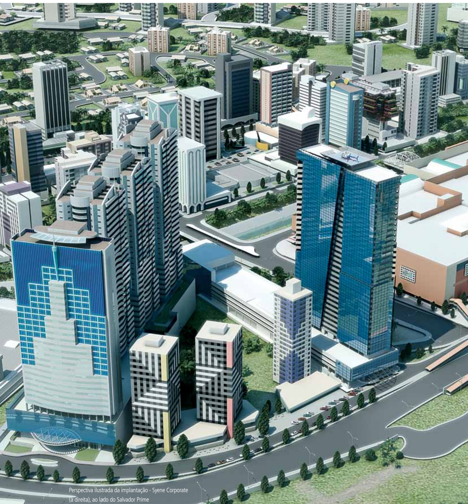
Perspectiva ilustrada da implantação - Syene Corporate (à direita), ao lado do Salvador Prime