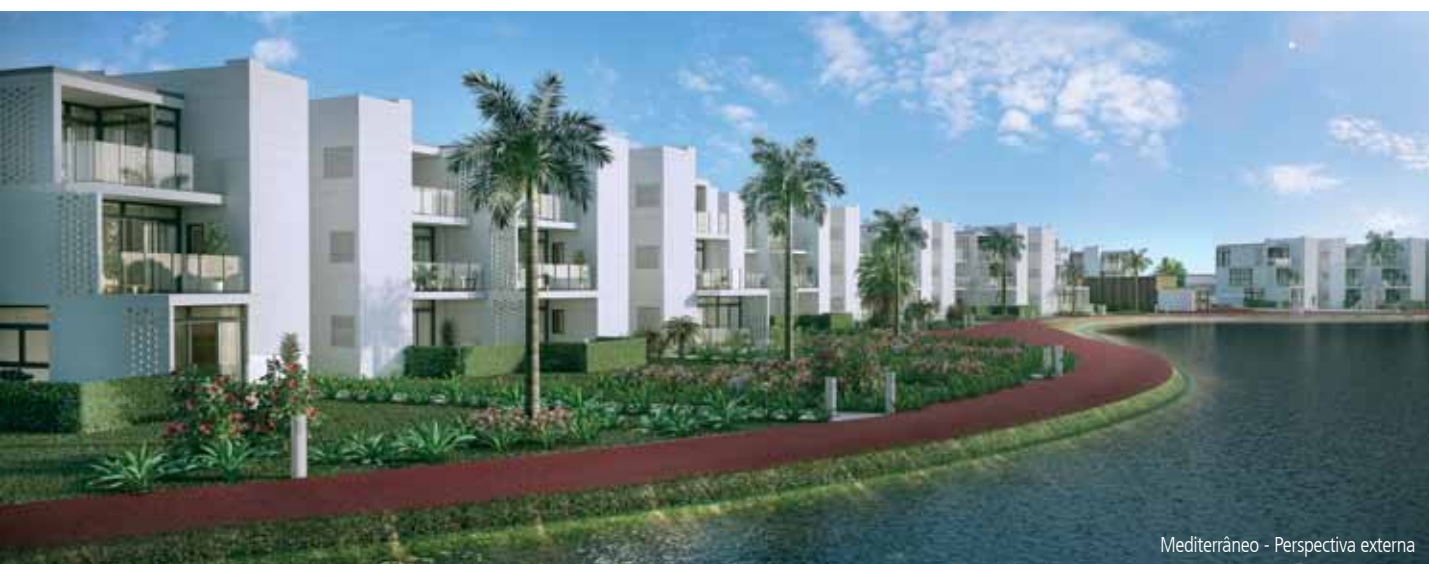
Mediterrâneo - Perspectiva externa