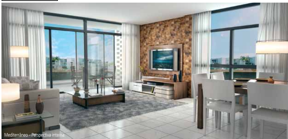
Mediterrâneo - Perspectiva interna