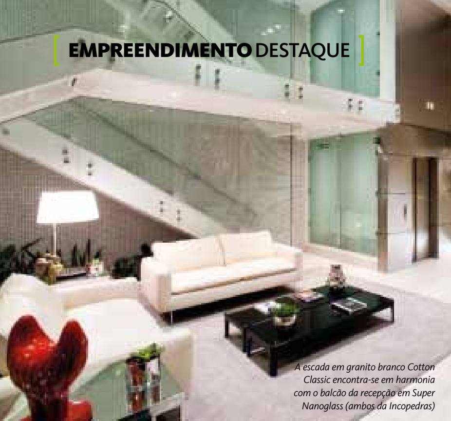
A escada em granito branco Cotton Classic encontra-se em harmonia com o balcão da recepção em Super Nanoglass (ambos da Incopedras)