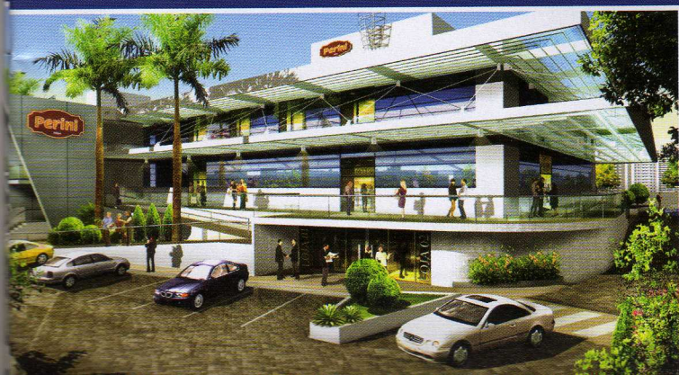
Riomar Trade Center - SE

AC - É ter a certeza de que muito se tem por fazer, é ter a consciência de que a criatividade e a inovação são as ferramentas poderosas e fundamentais para se superar as limitações de ordem tecnológicas dos sistemas construtivos disponíveis, bem como superar as limitações de recursos de ordem econômica dos empreendimentos.