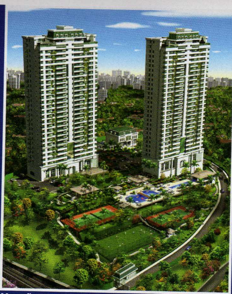
Mansão Vale do Loire