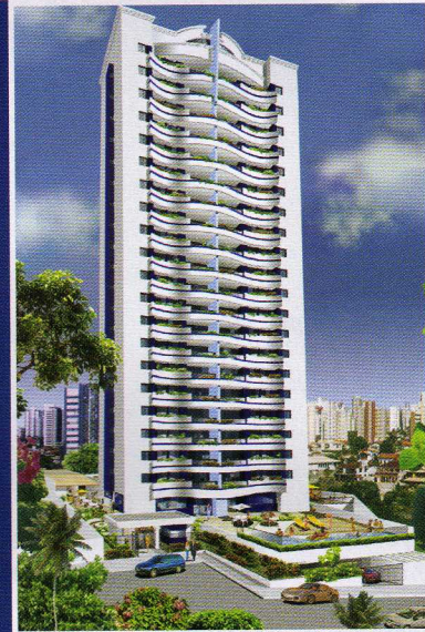
Mansão Ilha de Delfos