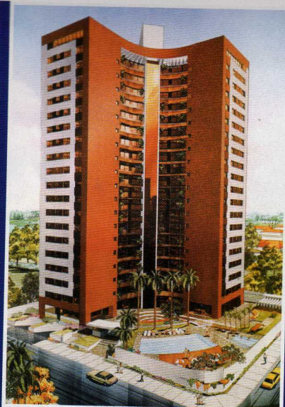
Ed. Pedro Manoel - SP