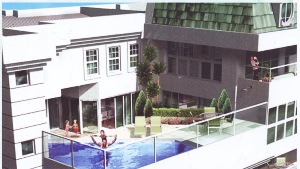
Espaços priorizam a beleza e o conforto

Caramelo - Proporcionar beleza, conforto e liberdade aos seus moradores. A amplidão dos espaços mostra isto bem. Para se ter uma idéia, a área que integra o living, a sala de jantar, o home theater, o home office e os varandões tem 138m 2 . Só o padrão das duas torres, com residências que remetem aos espaços genero-