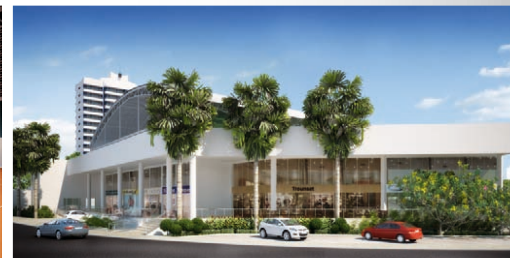
LOJAS DA NOVA ASSOCIAÇÃO ATLÉTICA.