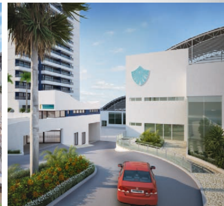
ACESSO DA NOVA ASSOCIAÇÃO ATLÉTICA.

O BARRA EXCLUSIVE TEM TUDO QUE VOCÊ PRECISA DENTRO E FORA DO CONDOMÍNIO.