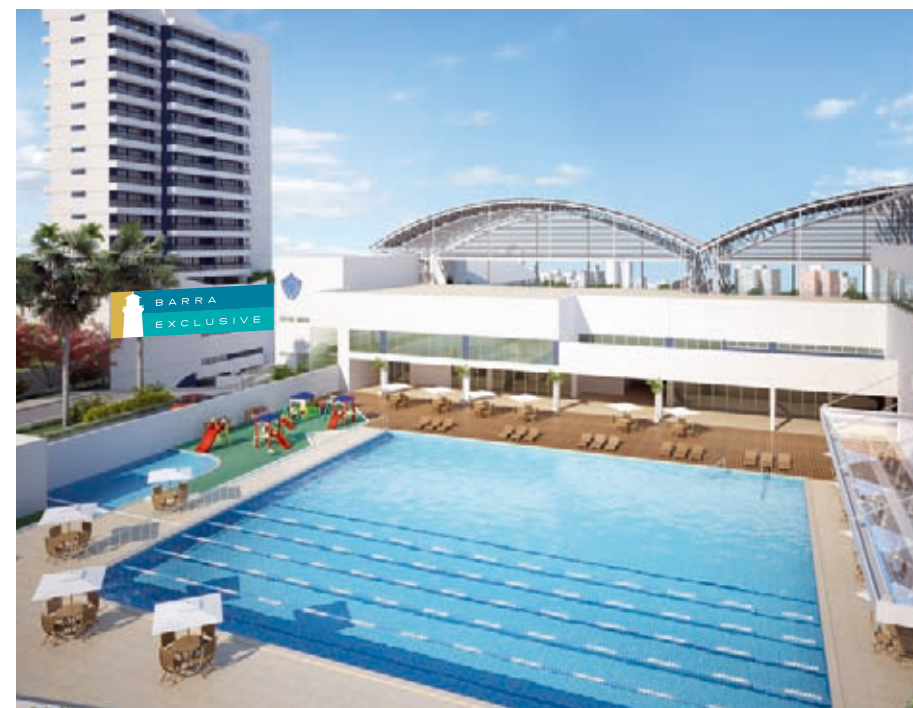
PISCINA DA NOVA ASSOCIAÇÃO ATLÉTICA.

VENHA SER VIZINHO DA NOVA AAB E USUFRUA DO CLUBE MAIS MODERNO DE SALVADOR.