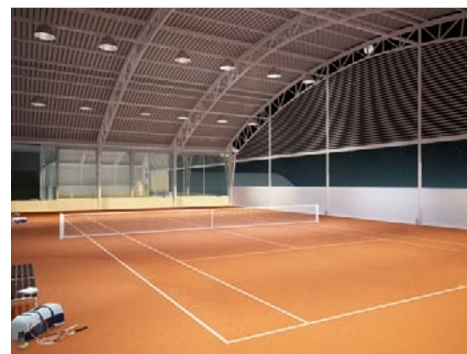
QUADRA DE TÊNIS DA NOVA ASSOCIAÇÃO ATLÉTICA.

*Vantagem opcional, contra pagamento da mensalidade do clube no valor atual de R$ 150,00. Uso após habite-se.