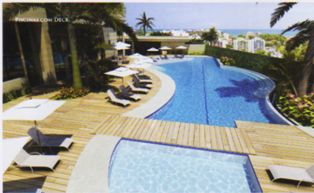
PISCINAS COM DECK