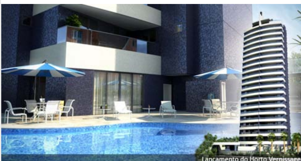
Lançamento do Horto Vernissage