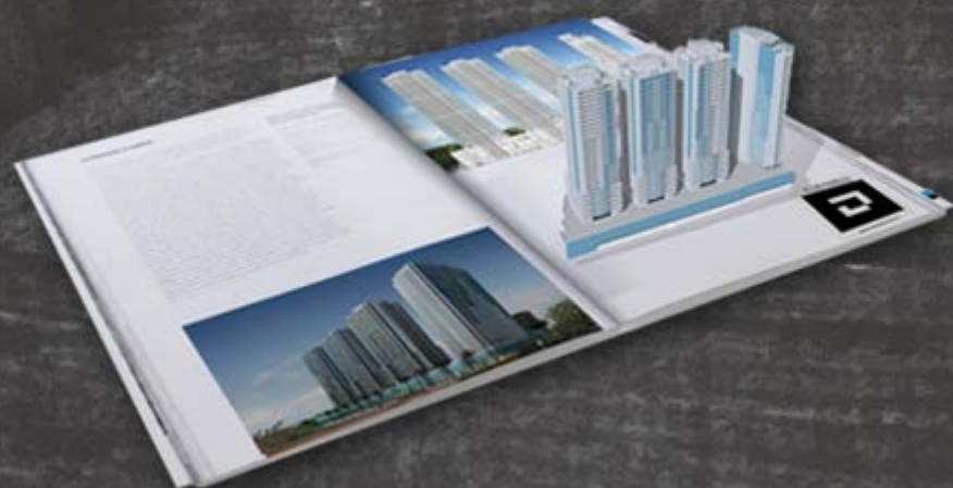
Representação do funcionamento da realidade ampliada (RA)