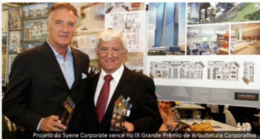
Projeto do Syene Corporate vence no IX Grande Prêmio de Arquitetura Corporativa