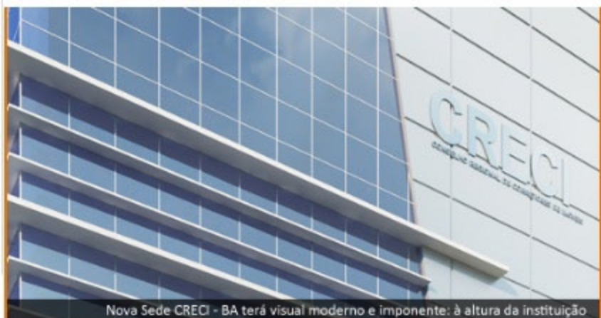
Nova Sede CRECI - BA terá visual moderno e imponente: à altura da instituição