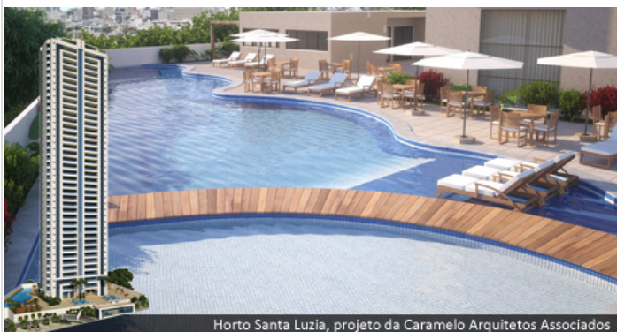
Horto Santa Luzia, projeto da Caramelo Arquitetos Associados