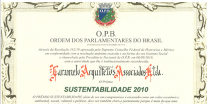
Prêmio de Sustentabilidade, mais um reconhecimento para a Caramelo Arquitetos